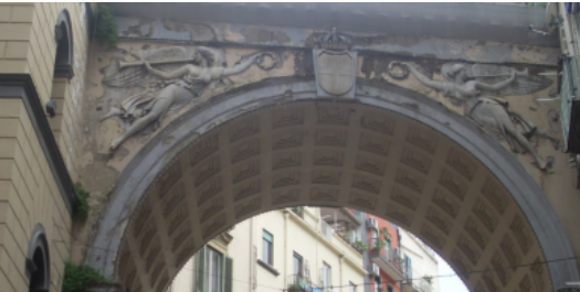
Ponte di Chiaia rimesso a nuovo. Inaugurazione con il sindaco