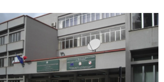
Corso per abilitare studenti all'uso del defibrillatore