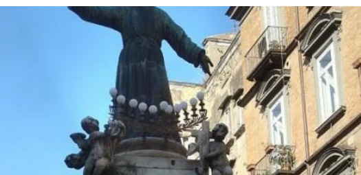
Al via il progetto per la statua di San Gaetano