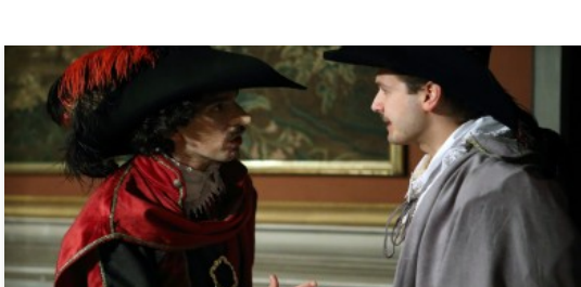
Teatro, alla Reggia di Caserta va in scena il Cyrano de Bergerac