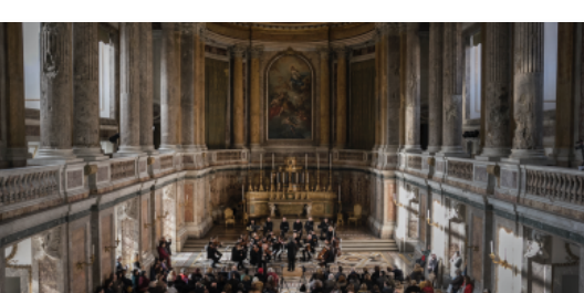
Musica classica d'autore alla Reggia di Caserta