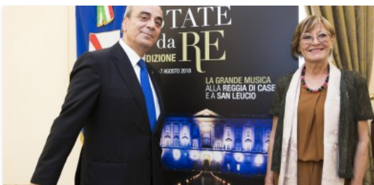
Un'estate da re, dalla Nona di Beethoven a recital di Kaufmann