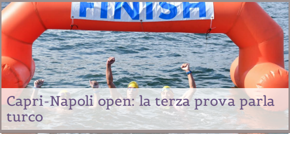
Capri-Napoli open: la terza prova parla turco