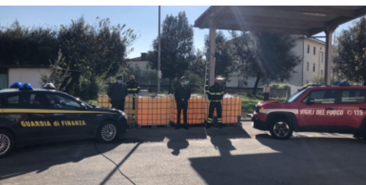
Gdf, 30 mila litri di gasolio per i Vigili del fuoco