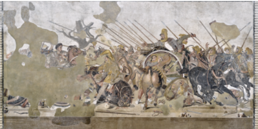
Mosaico di Alessandro, concluso il ribaltamento all'uso del defibrillatore