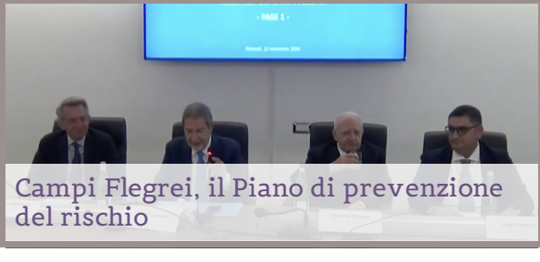
Campi Flegrei, il Piano di prevenzione del rischio