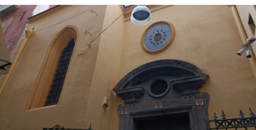
Torna a splendere la facciata di Santa Lucilla