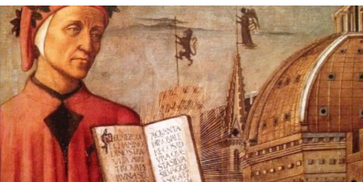
Divina Commedia No-stop, la lunga "Maratona Dantesca" alla Reggia