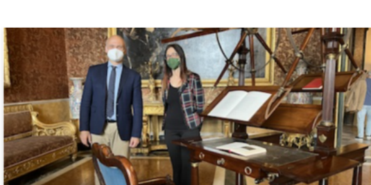
Restaurato il leggio di Maria Carolina d'Austria