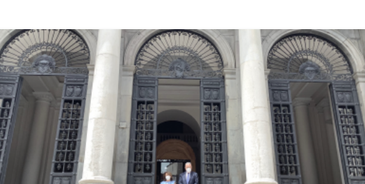
Federico II, riaprono le porte della sede storica