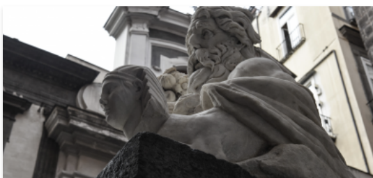
Riportato al suo splendore il Corpo di Napoli