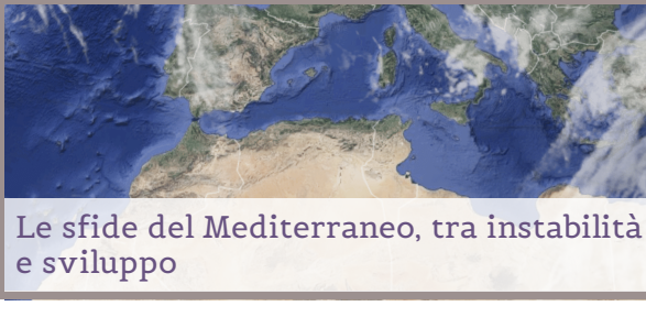
Le sfide del Mediterraneo, tra instabilità e sviluppo