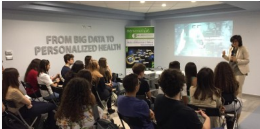
Settimana della Scienza, studenti nei laboratori del Polo Neurobiotech di Caserta

Vietri sul Mare al "Na Praia" Festival in Brasile →