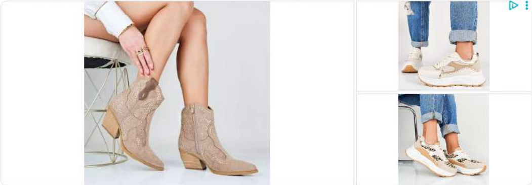
Scarpe Per Ogni Occasione Ormeshop

Sabato 14 giugno, alle 16.30 , il Liceo Scientifico “Leonardo Da Vinci” di Vairano Patenora – Scalo inscenerà “Miasma, L’ultima danza delle Erinni” (Libero adattamento dall’Oresteia di Eschilo)